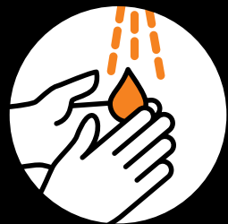
Gründlich Hände waschen.