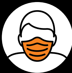
Empfehlung: Maske tragen, wenn Abstandhalten nicht möglich ist.